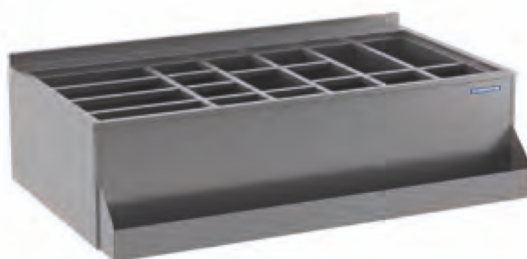
Módulo Drink Módulo Drink