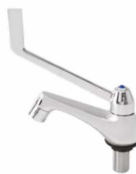
Torneira de bancada linha Bar Grifo de encimera línea Bar