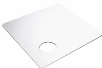
Tabua para corte em polietileno Tabla de corte en polietileno